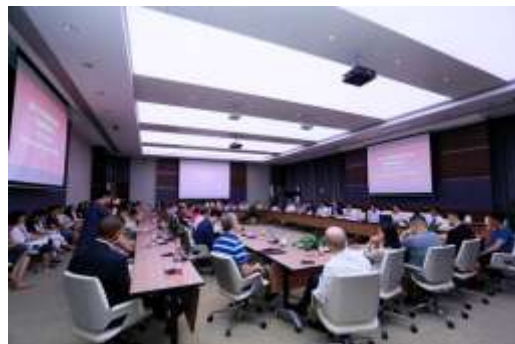
外籍教师座谈会现场

吴云东在座谈中指出，外籍教师离别家乡和亲人不远万里来到深研院，为学科建设、科学研究提供智力支持，为国际化校区的发展献计献策，对此他表示十分感谢。未来深研院将进一步做好服务外籍教师的工作，让大家感受到学院的温暖与关怀。吴云东对郝平一行来深调研表示欢迎与感谢，并表示深研院全院上下会齐心协力为北大在深的发展不断努力。