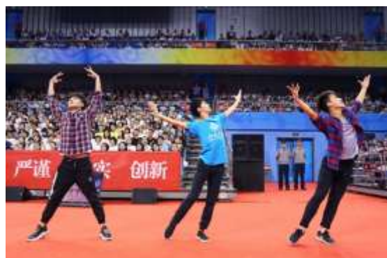
学生舞蹈团舞蹈《少有人走的路》