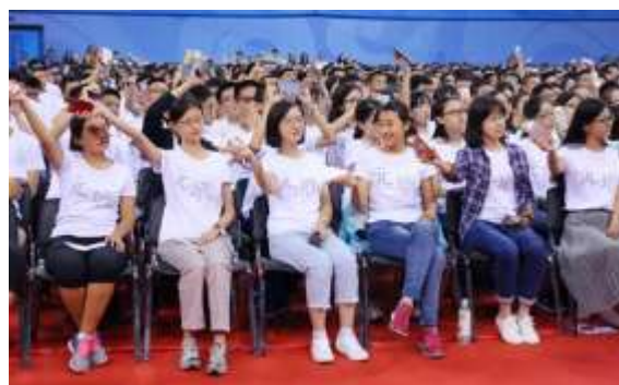
热情的新生挥舞着手机