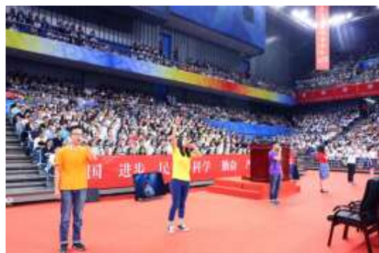
阿卡贝拉清唱社演唱《燕园情》