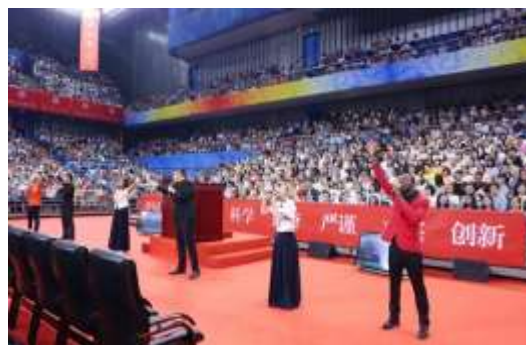
学生合唱团演唱《成都》（北大版）

在等待典礼正式开始的暖场环节，学生合唱团成员教唱全体新生《燕园情》，新生们一句一句认真地学唱：“我们来自江南塞北，情系着城镇乡野；我们走向海角天涯，指点着三山五岳……”学生合唱团演唱《成都》（北大版）时，场内激情涌动，同学们纷纷打开手机电筒挥舞并跟唱“博雅塔下绿茵浓，走过多少春秋；未名湖畔石舫舟，一池春水吹皱……”场内掀起了一个小高潮。接着同学们跟着阿卡贝拉清唱社唱起了刚学的《燕园情》，“燕园情，千千结……”有的同学流下了激动的泪水。随着学生舞蹈团舞蹈《少有人走的路》结束，在同学们热烈的掌声中，学校党委书记郝平、校长林建华等校领导，以及各学部、院系和相关职能部门的负责人步入典礼现场。