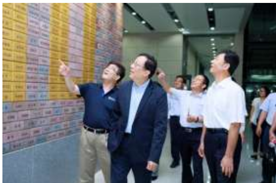
郝平等校领导参观汇丰商学院

郝平一行看望了正在参加深圳研究生院 2017 年新生开学营活动的全体新生。面对朝气蓬勃的 2017 级新生，郝平代表学校欢迎新同学的到来。看到大家的精神面貌，他感到十分高兴。郝平表示，深研院的同学们每次在学校本部参加活动展现的南燕风貌都给他留下了深刻的印象。他强调，深研院是北京大学的重要组成部分，是北京大学改革创新的重要试验田，为北京大学建设国际化校区作出了重要贡献，学校对深研院的发展一直寄予厚望，此次前来调研也是为了进一步推动北京大学深圳校区的建设和发展。