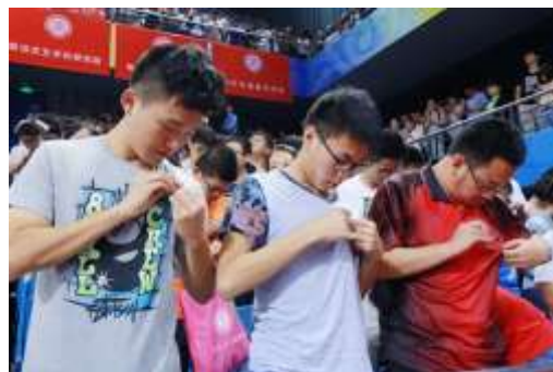
新同学们认真地佩戴北大校徽

随着视频《永远的校园》放映，开学典礼结束，同学们依次离场，去开启自己的燕园学术之旅。（文/新闻网记者 张宁）