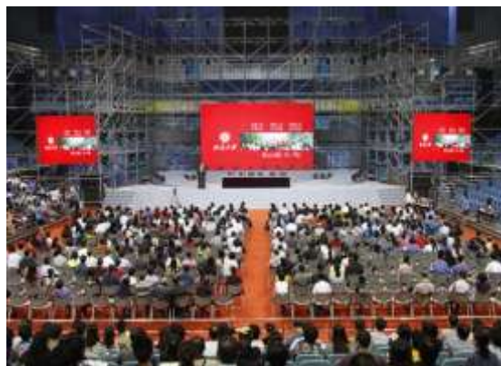
招生信息发布会现场

上午8:30,北京大学2015年本科生招生信息发布会在在邱德拔体育馆内举行,北大副校长、教务长、本科生招生委员会主任高松,副教务长、本科生招生专家委员会主任关海庭,副教务长、生命科学学院副院长李沉简,生命科学学院教授、北京招生组组长许崇任,法学院教授孙东东等参加了发布会,发布会由招生办公室主任王亚章主持。