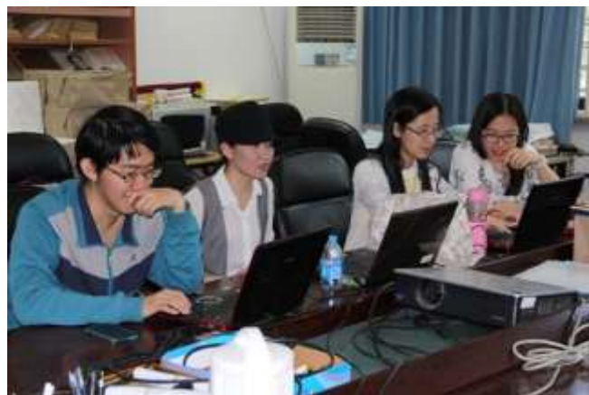
工作人员进行网上招生咨询

生信息发布会，发布会由“新浪教育频道”负责实施主题微直播，为不能现场参加校园开放日的考生与家长提供最直接、最全面的招生信息和政策咨询服务。