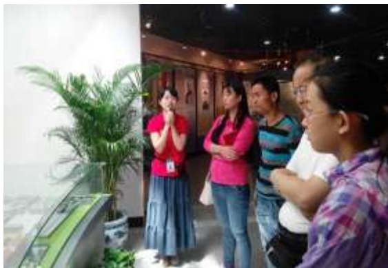
校史馆义务讲解员为参观的考生和家长 介绍北大历史