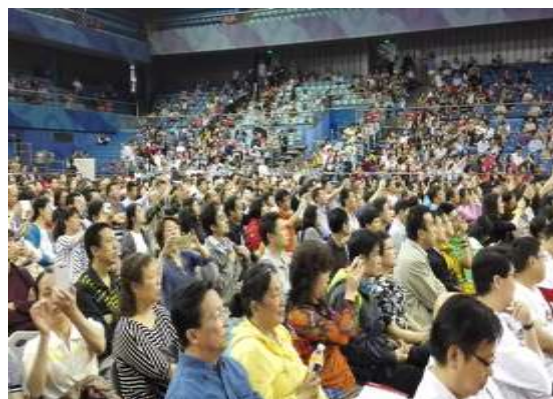
认真听讲的考生和家长

6000 多人，最终通过初审为 1900 人；报考博雅人才培养计划的考生 1.1 万余人，通过初审 1946 人。据介绍，为了确保初审过程的公平公正，北大本科招生专家委员会制定了严格的评审流程和标准，经过至少三轮审核，集体决策最终通过初审的考生名单，并对淘汰的考生逐个进行复审，确保结果准确无误，参与评审的专家共计约 200 人。