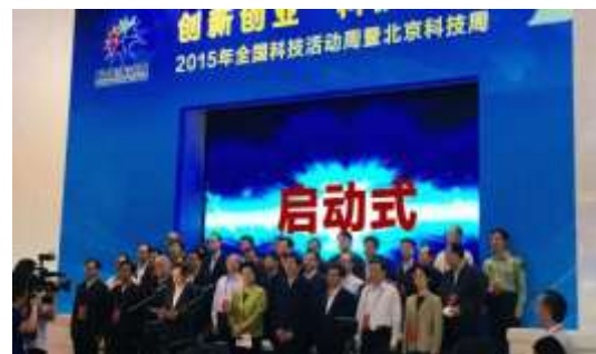
全国科技周启动仪式现场

北大校友会副秘书长、北大创业训练营教务长王健向刘延东、郭金龙、万钢等领导汇报了北大创业训练营及参展营员企业发展情况。