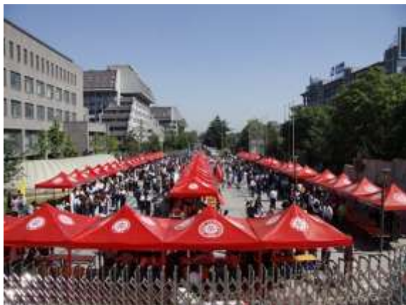
本科生招生咨询会现场

今年的校园开放日仍然采取实体校园开放和网络校园开放相结合的方式举行。北大招生办公室、进行本科招生的25个院系、医学部、相关职能部门均安排咨询服务人员在活动现场接待广大考生和家长,针对他们所关心的2015年招生政策、专业选择、教学培养、国际交流、助学体系、就业情况、校园文化活动等与本科生学习生活及发展有关的问题进行现场解答。活动当天,部分国家重点实验室、图书馆、校史馆、博物馆、教学楼、体育馆等也向考生和家长开放。北京师范大学、复旦大学、上海交通大学、南京大学等内地高校,以及香港大学、香港中文大学、香港城市大学等香港高校也在咨询会布展,接受考生和家长咨询。