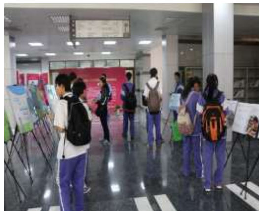
考生到北大图书馆参观

考生和家长凭图书馆参观证便可进入图书馆参观，一位考生在参观完图书馆后表示，北大丰富的资源以及浓厚的学术气息很吸引他，期待以后能进入北大学习。