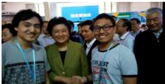
刘延东副总理与北大学生合影留念

科技周期间，北大学生创业项目“玩嗨”获得了北京市“公众参与创新北京行动计划（第一季）”优秀项目团队奖。北大产业技术研究院将继续以课程建设和学生成才为核心，坚持“创新激发创业，带动成果产业化”的教育理念，开放办学，持续深入推进创新创业教育。