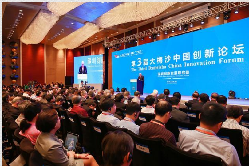
第3届大梅沙中国创新论坛在深圳举行

很高兴在这里跟大家见面！特别在这个场合，有很多跟中国教育改革有关的相关工作人员。我在韩国作为教育部长官、教育部长一直致力于教育改革这些事情，这些年一直关注的是教育改革方面。